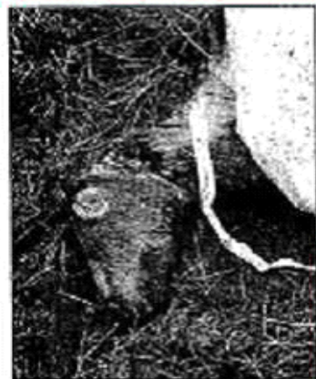
So bestialisch wurde das Shetland-Pony zugerichtet.